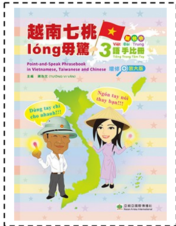
《越南七桃 lóng 毋驚》增修放大版 ISBN : 978-986-9447942