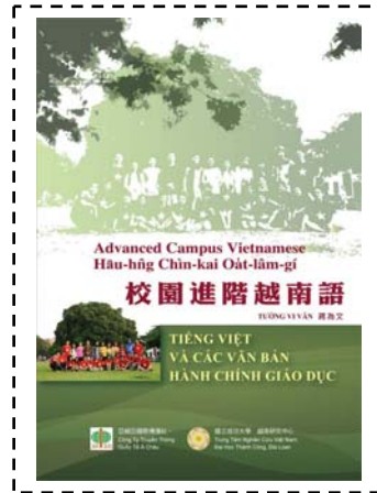
《校園進階越南語》 ISBN : 978-986-8541863

◆上述出版品請讀者依需要自行上網訂購 PC-Home 24H 、 PC-Store 白象文化 、 PC-Store 海翁起動 、 博客來 、 府城舊冊店 、 台南政大書城 、 台灣e店 、 燦爛時光 、 東南亞主題書店 及各大書局訂購。