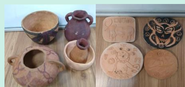
陶藝、泥塑及浮雕成果